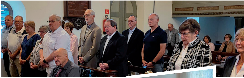
Zum Jubiläumsgottesdienst hatten sich die Jubilare in der Kirche zu Langewiese versammelt.