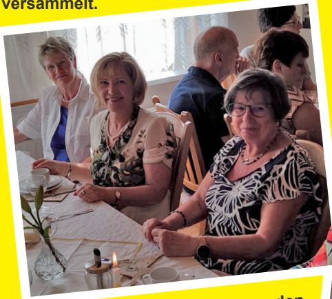
Beim gemeinsamen Frühstück wurden viele Erinnerungen und Anekdoten ausgetauscht.