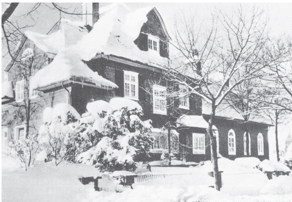
Winterberg – Ansicht ab 1926

Weiter erfuhren die gut 20 Zuhörer, darunter auch einige Heimatfreunde aus Winterberg, dass es auch vor 1802 immer wieder Protestanten im Raum Winterberg gab, deren Zahl dann nach der Inbesitznahme durch Preußen stetig zunahm. Den Abschluss des Vortrags bildete dann die Geschichte der hiesigen evangelischen Gemeinden bis zur Bildung der heutigen Friedenskirchengemeinde Hochsauerland. (FO)