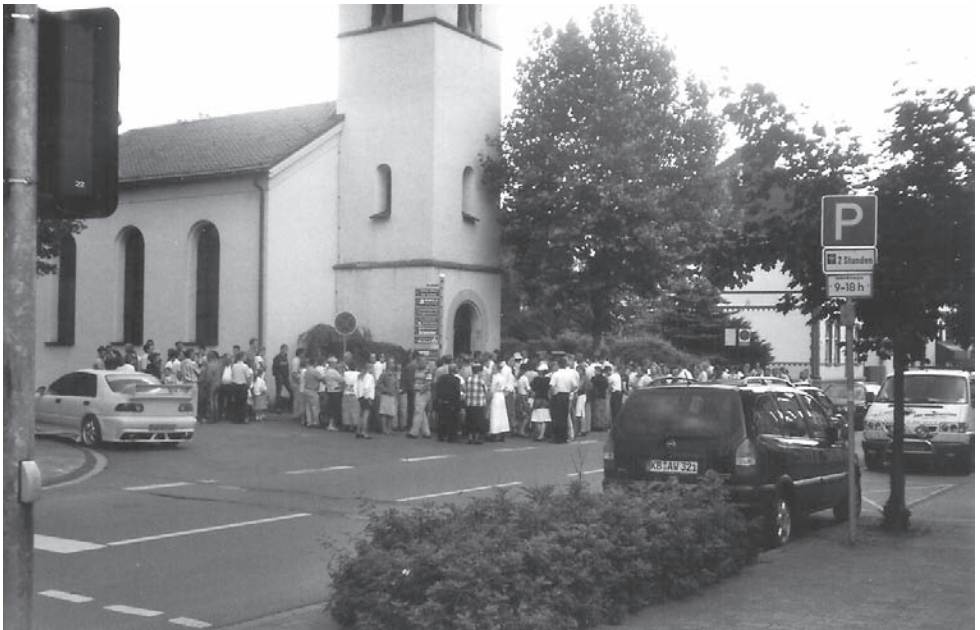
Dicht gedrängt warten die niederländischen Protestanten auf den Gottesdienst