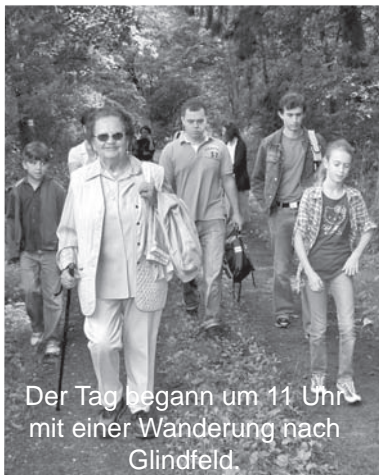
Der Tag begann um 11 Uhr mit einer Wanderung nach Glindfeld.