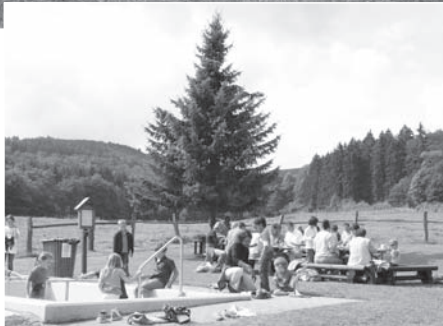
Eintreffen am Tretbecken - gemeinsames spielen, planschen und grillen.