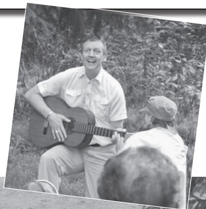
Gottesdienst zum Thema Schöpfung an der Lichtung kurz vor Glindfeld, wo der kleine Kreuzweg anfängt.